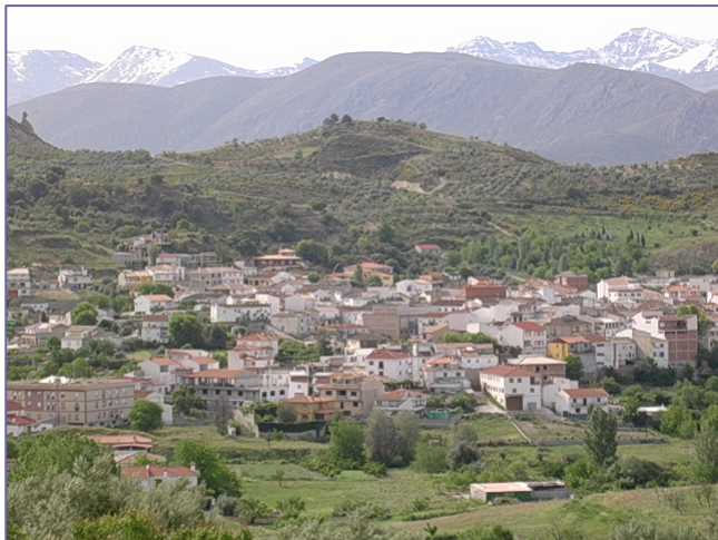
Paysage du massif de la Sierra Nevada

Le secteur industriel peut être divisé en deux groupes: les industries alimentaires (boulangerie à Alfacar et à Víznar) et l'extraction et la transformation de minéraux non métalliques (carrières et activités dérivées à Huétor Santillán et Beas de Granada). Les deux groupes représentent 78% de l'emploi industriel de l' AIS.