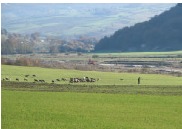
Paysage typiquement rural territoire de Marmo Platano.

Le territoire impliqué par le sous-projet MEDITOUR montre une superficie globale presque de 450 Kilomètres carrés et il est localisé dans la portion du Nord-Est de la Basilicata, en arrière de la chaîne de l'Appennino Lucano, en présentant des altitudes qui s'élèvent de 600 à 1.500 mètres au dessus du niveau de la mer, et des caractéristiques typiques des régions montagneuses. L'emploi du sol montre une nette prédominance (63%) de surfaces naturelles (dont les 2/3 sont représentée par des gazons et des pâturages et 1/3 par des forêts); les sols agricoles intéressent environ 35% du territoire et ils sont cultivés principalement de céréales et de fourrages.